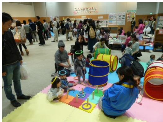
▲昨年の子育てフェスティバル

毎年、子育てに関する情報を一度に集めることができる「かわにし子育てフェスティバル」にファミサポ、川西さくら園、川西久代児童センターも参加しています。当日は、会員登録の受付、入会説明、遊びのブースをしていますので、皆さんお誘いあわせのうえ、お越してください。お仕事をされていて、平日に登録できない方が身近にいらっしゃいましたらお知らせください。この日は、その場で入会登録ができます。（簡単な入会説明あり）