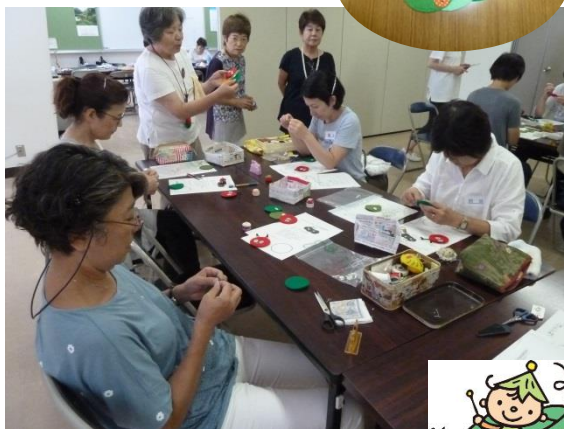
▲ カラーフェルトで いもむし製作に挑戦！！