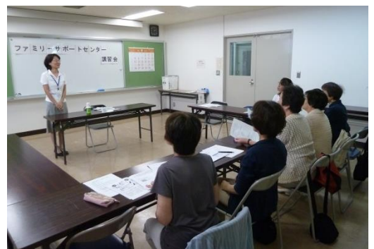
▲アットホームな中での研修でした！