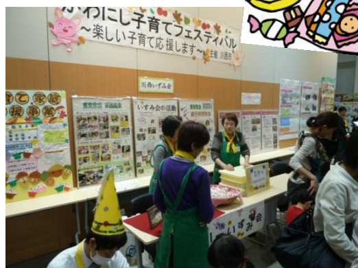
▲川西いずみ会によるお菓子配布（先着200名、子どものみ）